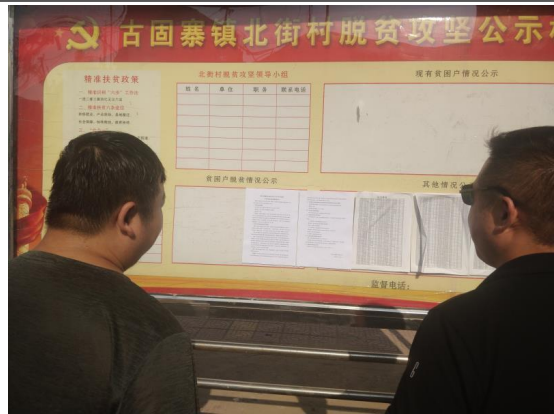
古固寨镇北街村张贴公告