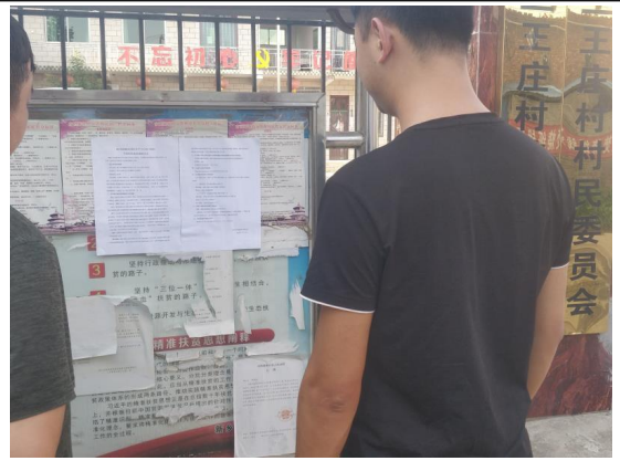
三王庄村张贴公告