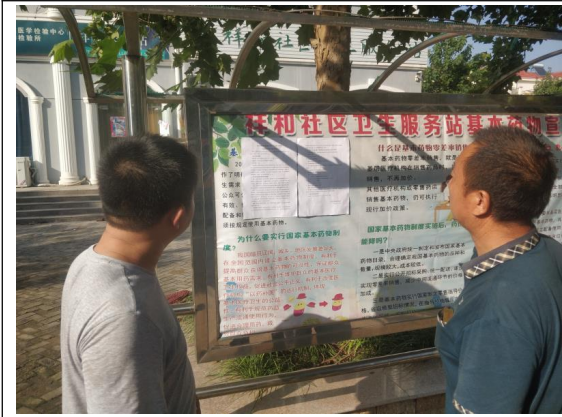
祥和社区张贴公告